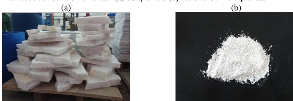
Figura 1. Resíduos de rocha ornamental: (a) casqueiro e (b) resíduo do filtro prensa.

Para se ter um maior conhecimento dos resíduos foi realizado uma caracterização dos materiais coletados. As análises realizadas foram: Fluorescência de Raio-X (FRX) e Difração de Raio-X (DRX).